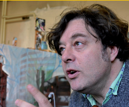
Alejandro Soto Bildener Künstler